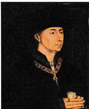
Filips(III) de Goede

Ze verzamelde heel wat krediet buiten het hof op die manier, maar haar wettelijk echtgenoot had in tussen tot dertig maitresses en achttien (toegegeven) bastaard-kinderen. Er was grote onenigheid tussen de hertog en zijn troonopvolger Karel (de Stoute) die op Isabella kon rekenen. Op die manier was er een lat-relatie ontstaan en trok ze zich terug in het kasteel bij Morbecque nu bij het Forêt domaniale de Nieppe. Vanaf 1465 verzonk de hertog in seniliteit.