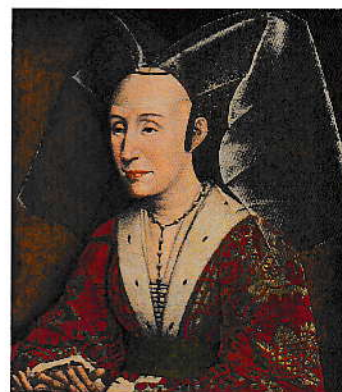
ISABELLA VAN PORTUGAL (1397-1471)