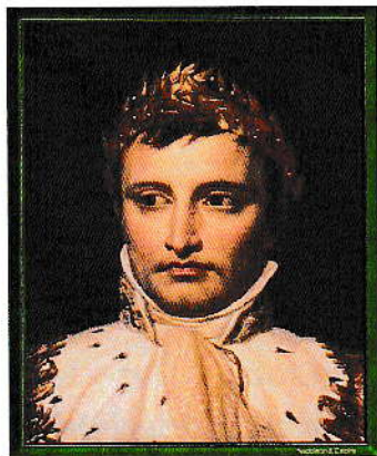
Napoleon Bonaparte 1808

[ Een conflict tussen Napoleon met Groot-Brittannië leidde tot een blokkade tegen de Engelse handel met het vasteland ... waaraan o.a. Portugal, Denemarken en Rusland zich niet hielden. Napoleon wou Spanje domineren door een stuk van Portugal aan te bieden. Uiteindelijk zette hij zijn broer op de Spaanse troon ... en dat kon Engeland niet over haar kant laten gaan ! Ze stuurden Arthur Wellesley (Wellington)]