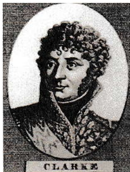
Henri Jacques Clarke

Op 30 augustus kreeg de stad bezoek van de “minister van oorlog” die op inspectie van “alle de stadswerken besigtigen of die in staed van tegen weir waeren”.